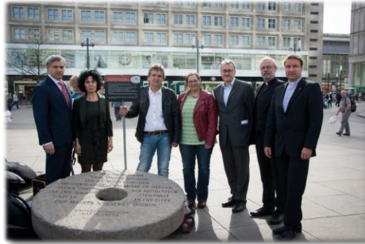
Berlin April – August 2015