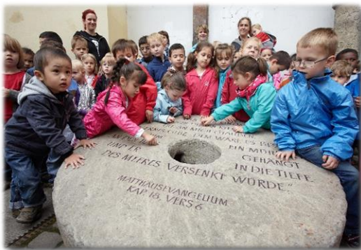
Koblenz Juni – Juni 2011