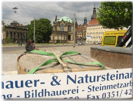
Dresden Juni – August 2014