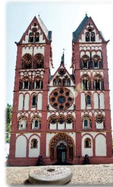
Limburg September 2012