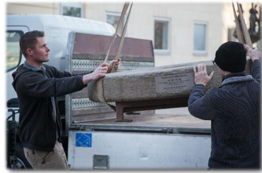
Magdeburg Februar – März 2015