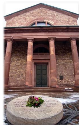
Karlsruhe Stadt Dezember 2010 – Januar 2011