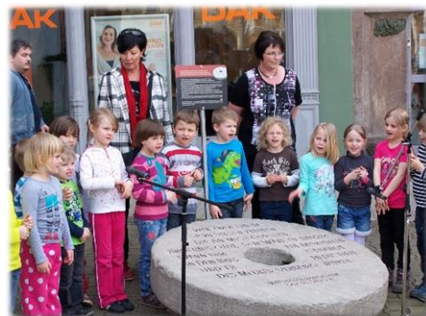
Gotha April – Mai 2014