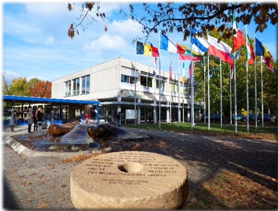
Karlsruhe, Europäische Schule Oktober – Dezember 2010