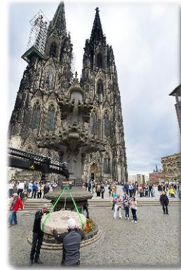
Köln Juni – Juli 2012