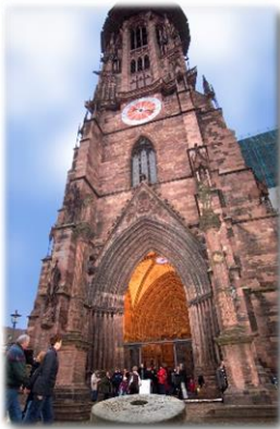
Freiburg im Breisgau