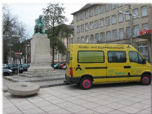
Saarlouis Dezember 2011 – Februar 2012