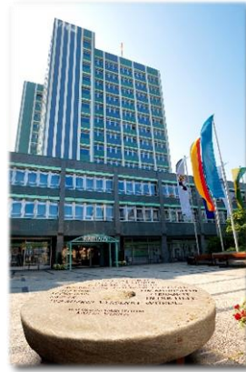
Bayreuth Juli – September 2010