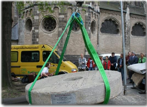
Bonn Mai – Juni 2012