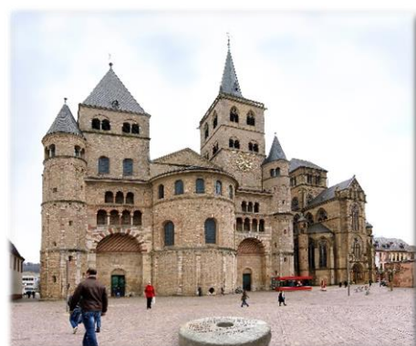
Trier März – April 2012