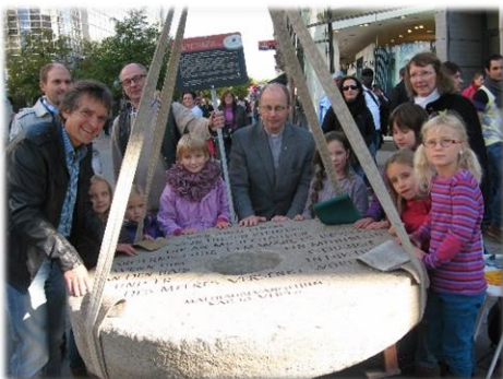
Hannover September – Oktober 2013