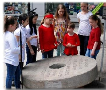
Hildesheim Juni – Juli 2013