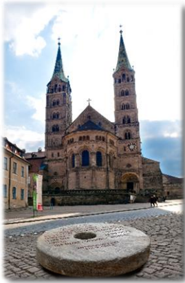
Bamberg April – Mai 2010