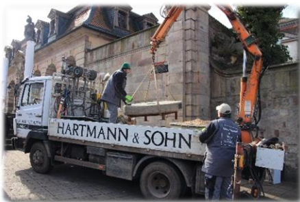
Fulda März – April 2013