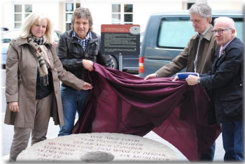
Neuwied Juli – August 2012