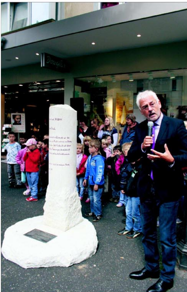
Bürgermeister Franz Huhn unterstützte umgehend die Initiative.