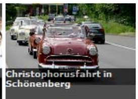
Christophorusfahrt in Schönenberg