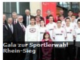
Gala zur Sportlerwahl Rhein-Sieg