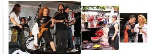
(7 Alben) »