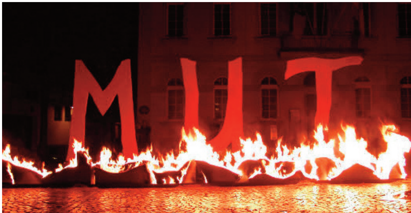
Nach der Buchvorstellung wird am Donauufer eine Feuerinstallation stattfinden.

tung von Unwahrheiten zurück. Die Kirche hat anscheinend kein Interesse daran, strafrechtliche Tatbestände aufzuklären, anzuklagen und vor ein unvoreingenommenes weltliches Gericht zu bringen. (...) Sie vertuscht, gibt nur so viel zu wie unbedingt nötig, und das auch nur, wenn der Druck von außen durch Pfarrangehörige zu groß wird.“