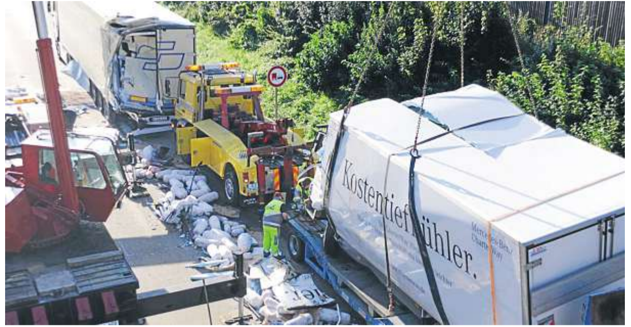
Der vordere Lkw hatte gefrorene Döner-Spieße geladen. Sie lagen nach dem Unfall verteilt auf der A 3.

Der 18-Jährige wurde dabei ebenfalls leicht verletzt. Der genaue Unfallhergang wird nun von einem Gutachter geprüft. Die Autobahn wurde in Richtung Passau mehrere Stunden lang gesperrt. Insgesamt entstand ein Schaden von rund 150 000 Euro. Ein Großaufgebot an Rettungskräften war vor Ort. Warum der Fahrer des 7,5-